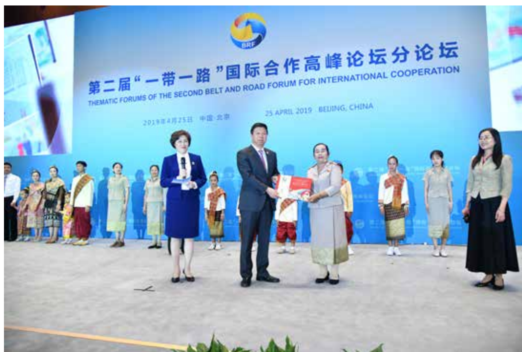
宋涛部长代收农冰村小学师生赠送习近平主席的画册

2019 年 4 月 11 日，农冰村小学的师生们给“一带一路”的倡议者中国国家主席习近平写了一封信，表达对中国援建农冰村小学的真挚谢意和参与“一带一路”建设的积极意愿。4 月 25 日，师生们在民心相通分论坛上带来了亲手制作并赠送给习近平主席的画册。习近平主席于 4 月 29 日给农冰村小学全体师生回信，勉励他们做中老友好的接班人。该校全体师生在阅读了习主席的回信之后备受鼓舞。习近平主席和农冰村小学师生的信件引起了两国民众的热议。