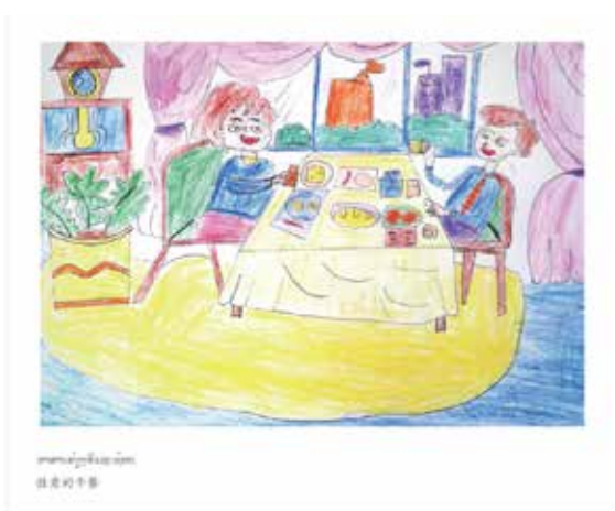
农冰村小学师生绘制的图画