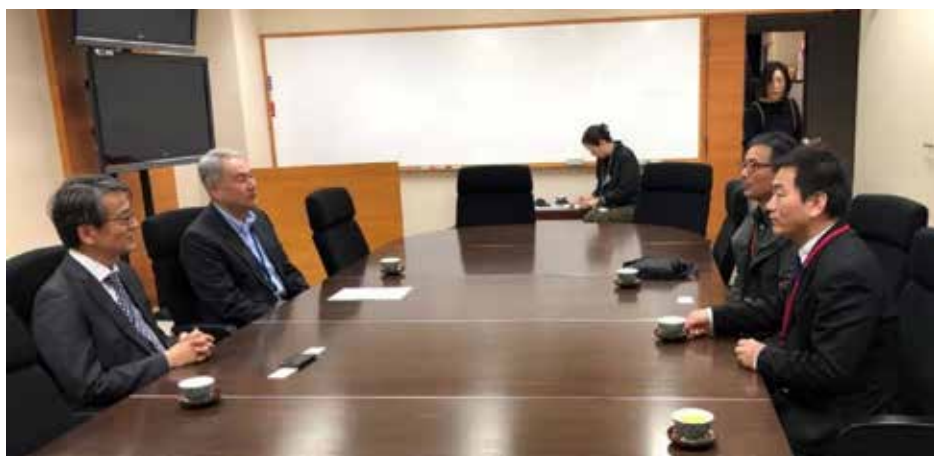
日本国立传染病研究所接收中国驻日本大使馆代表、猛犸基金会代表转交检测试剂盒

向18个国家及联合国人居署捐赠了价值300万元的物资。北京新阳光慈善基金会向伊朗、塞尔维亚、印尼等捐赠急需的核酸检测试剂盒、检测仪、口罩和防护服。北京恒济卫生管理发展基金会发起“北京中医药海外新冠肺炎防疫驰援行动”，向埃里温、明斯克、里约热内卢、巴西利亚捐赠了120万元的新冠肺炎预防药品。河北省向13个友好省州、16个友好城市、友好组织和人士捐赠价值471万元的防疫物资。山西省中医药大学附属医院配置中药方剂4500剂，支援意大利、德国、英国、瑞典等国。山西省红十字会向意大利、德国、韩国、日本捐献了价值96万元的防护服和护目镜。内蒙古自治区红十字会向蒙古、美国、英国、马达加斯加、多米尼加等10个国家捐赠了一次性医用口罩64.8万只、N95口罩10万只、外科口罩2万只、防护服1.9万件等。吉林省对外友协向俄罗斯、法国、芬兰等