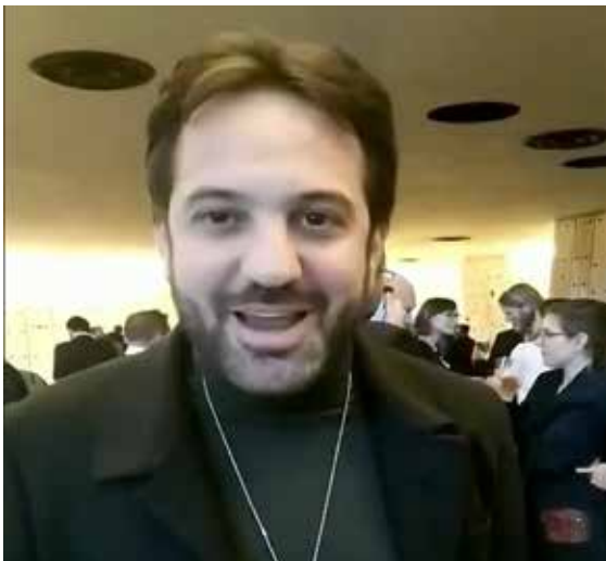
联合国人道主义事务顾问穆拉特·尤泽

国际计划生育联合会总干事阿尔瓦罗·贝尔梅霍表示，中国人民正面临巨大挑战。但是历史证明，中国人民将会团结一心，众志成城，共同克服这些挑战。2003年中国成功控制非典就是很好的证明。中国现在需要来自全球的支持。我们会尽最大努力，向中国提供符合标准的急需的防护物资。中国的紧急疫情也是我们的紧急疫情。国际计划生育联合会首批募集的10万只N95口罩已运送到中国医护人员手里。同时，我们还发布了全球倡议，号召全球捐助者为中国捐赠口罩和其他防护用品。国际计划生育联合会一直与中国人民团结在一起。