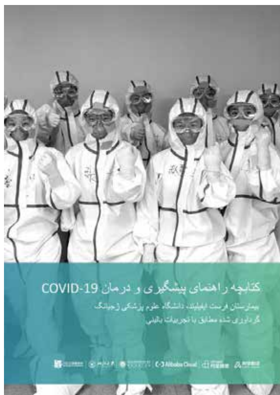
波斯语版《新冠肺炎防治手册——浙江大学医学院附属第一医院临床经验》封面

公益基金会等社会组织发起六批对外援助,向69个国家及东北亚地方联合会捐助460万只医用口罩,5950套防护服等。广东省对外友协联合理事单位向30多个疫情严重的国家开展捐赠。广东省总商会设立疫情防控专项基金超过1亿元,鼓励企业积极履行国际责任。深圳市社会组织累计向国外捐赠了144万只口罩,2000余套防护服,为35个国家和地区捐赠检测试剂4万套。广西壮族自治区对外友协向美国飞虎队历史委员会捐赠了价值25750元的防疫物资,向东盟10国及东盟秘书处捐赠了价值804万元的医疗用品。海南省慈善组织、红十字会、侨联、华商会、潮商经济促进会等捐赠防护服、N95口罩等医疗物资共计554万件。重庆市华岩文教基金会等社会组织向8个国家合作组织捐赠医用口罩、中医药物资共30万元。四川省民间组织国际交流促进会与