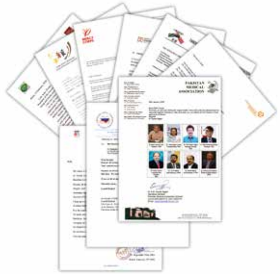
外方组织发来的慰问信

英国48家集团俱乐部主席史蒂芬·佩里表示，面对这场突发疫情，习近平主席、中国政府和全体中国人民表现出非同一般的勇气和决心，全力投入抗疫行动。英国女王和首相对中国表达了诚挚慰问和祝福，肯定了中国人民采取的行动。我对此感到振奋。千百年来，病毒