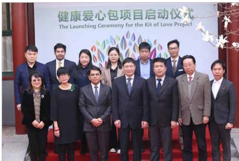
“健康爱心包”项目主办方与参与方集体合影

遗产基金会、中国计划生育协会、中华慈善总会、四川省慈善总会、中顺洁柔纸业股份有限公司、上海晨光公益基金会等十余家国内机构组织和爱心企业出席了启动仪式。